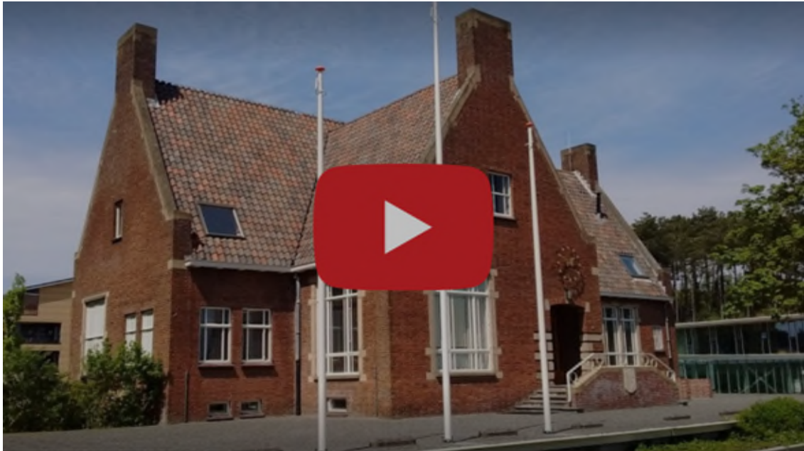
Gemeenteraadsvergadering, 12 mei 2021, Terschelling TV

In de gemeenteraadsvergadering van 12 mei is onder meer besloten over